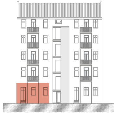
Ansicht Gartenhaus Rückseite

Gartenhaus, HP rechts 3 Zimmer, ca. 96,23 m 2 * Raumhöhe bis zu 3,18 m Zustand Istzustand Besonderheit Terrasse