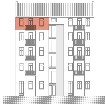
Ansicht Gartenhaus Rückseite

Gartenhaus, 4. OG rechts 3 Zimmer, ca. 117,02 m 2 * Raumhöhe bis zu 2,94 m Zustand Istzustand Besonderheit Balkon